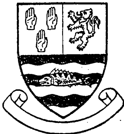
MACLOUGHLIN (formerly O'Melaghlin)

Las armas de los MacLoughlin que antes fueron O'Melaghlin son: cortado, el jefe partido, a la derecha en campo de plata, tres manos derechas cortadas en la muñeca, gules; a la izquierda, de plata, un león rampante, gules, con las garras y lengua azul; la punta, ondeada de azul y plata y un salmón nadando, naturalmente. Las de los de Tirconnell: cortado, azul y gules, en el jefe un león rampante de oro entre dos espadas de plata, el pomo y la empuñadura de oro, en la punta tres crecientes oro(2).